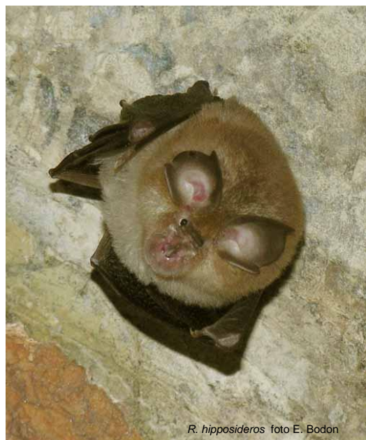
R. hipposideros

In Svizzera è stato suggerito che ciò abbia contribuito a un possibile caso di esclusione competitiva fra Pipistrellus pipistrellus e Rhinolophus hipposideros . La prima specie, alimentandosi sotto i lampioni, potrebbe aver sottratto alla seconda risorse trofiche essenziali nei momenti di minor disponibilità di prede (Arlettaz et al. , 2000). Va precisato che gli Autori del lavoro sono estremamente cauti nel suggerire tale ipotesi. Aggiungiamo che, in mancanza di una quantificazione della rilevanza per R. hipposideros del decremento nella disponibilità di prede a causa dei soli lampioni (ossia anche qualora non vi fossero P. pipistrellus a consumarle) risulta arduo chiarire il ruolo della specie competitorice (a determinare l'esclusione potrebbero bastare i lampioni).